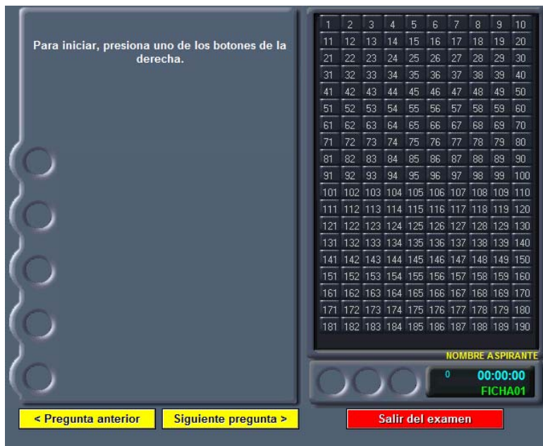
Figura 2. Interfaz del cliente SICODEX

Para dar mayor facilidad en la navegación o cambiar de pregunta, se agregaron 3 botones rectangulares de mayor tamaño en la parte inferior de la interfaz, los dos primeros son de color amarillo con las leyendas “pregunta anterior” y “pregunta siguiente”, que son utilizados para una mayor comodidad por aquellos aspirantes que pudieran tener alguna duda de cómo cambiar de pregunta. El tercer botón es de color rojo con la etiqueta “salir”, y es la forma de indicarle al sistema que el aspirante ya terminó de contestar su examen y desea salir del sistema. La figura 2 muestra la interfaz de CliSicodex.